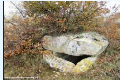
Белогорский р-н., МОЛБАИ