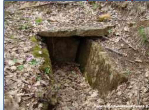
Севастопольский р-н., ТАШ-КОЙ.