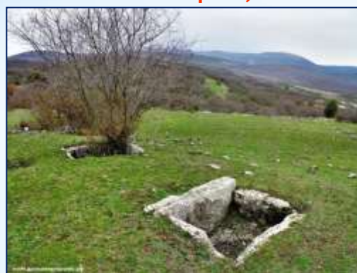
Севастопольский р-н., ТАШ-КОЙ.