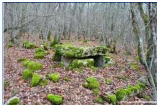
Севастопольский р-н., РОДНОЕ.