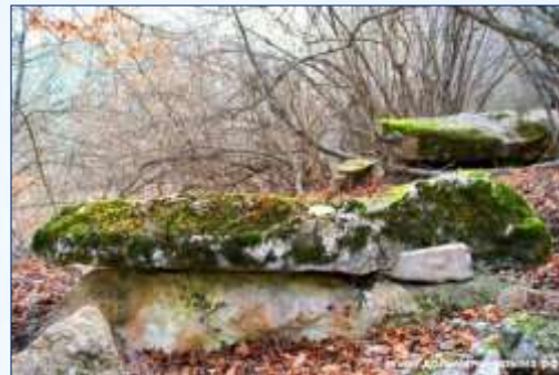
Севастопольский р-н., 2-ОИ КОРДОН.